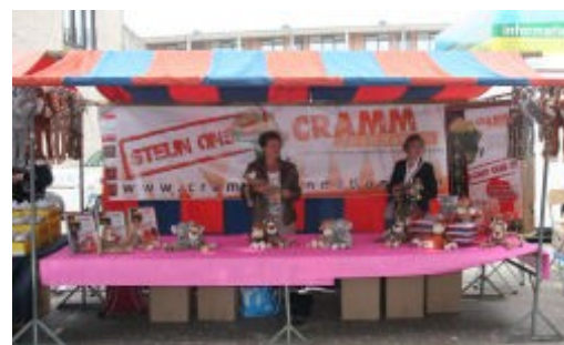
Kraam van Goghmert

De meeste mensen hebben onze stichting gesteund door een van onze 5 mascottes aan te schaffen. In totaal zijn deze middag 30 mascottes verkocht. Daarnaast hebben we 4 donateurs geworven die ons maandelijks steunen. Ondanks de ongunstige locatie hebben we voor een eerste deelname een prachtig resultaat boekt!