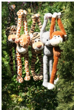
Ny-chee, Ny-gigi, Ny-tigi, Ny-oli en Ny-api

De stichting heeft een vijftal mascottes die symbool staan voor steun aan mensen met een beperking in een ontwikkelingsland.